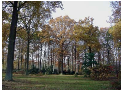
12 – Quercus robur : planté en 1885 (385 cm). Arb. Wespelaar