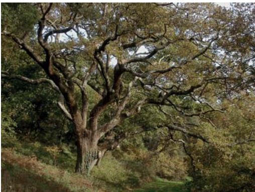
10 – Quercus pubescens. Massif des Maures, Var, France