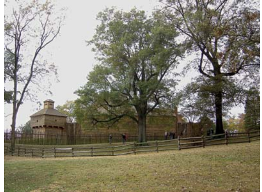
5 – Quercus phellos. Fort Massac, Illinois, USA

gros et impressionnants, bien plus que chez nous, conséquence de la bonne chaleur d'été de cette partie des USA.