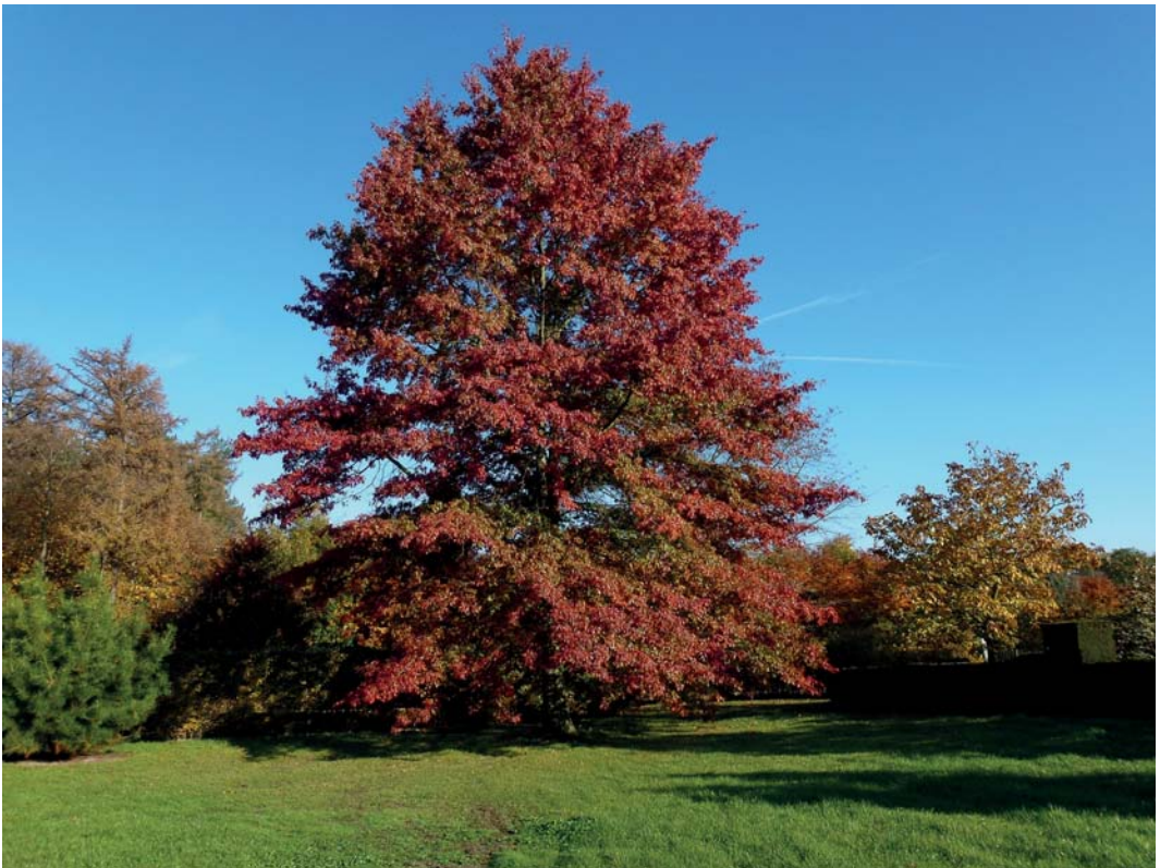
1 – Quercus palustris. Herkenrode, Wespelaar