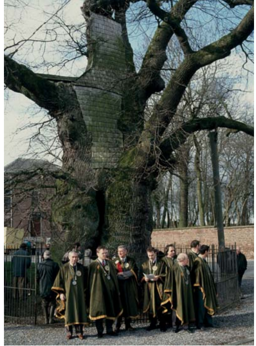
11 – Quercus robur : chêne de Liernu, champion de Belgique (986 cm). Liernu [Ph. de Spoelberch, 03-1994]