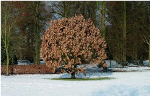
9 – Quercus 'Pondaim' ( Q. pontica × Q. dentata). Arb. Wespelaar