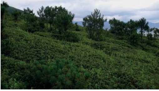
8 – Quercus monimotricha. Yuhu, Lijiang, Yunnan, Chine

aujourd'hui partie de l'Arboretum, et qui ont progressé en moyenne de 3 cm par an, pour atteindre le 385 cm de tour, pour le plus gros, après 130 ans [Ill. 12].