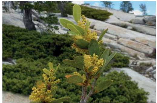
6 – Quercus vaccinifolia. Olmsted Point, Yosemite Nat. Park, California, USA