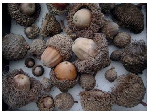
4 – Quercus macrocarpa, fruits spectaculaires. Starhill Forest, Petersburg, Illinois, USA

Les deux Quercus phellos que nous avons vus à Fort Massac, Illinois [Ill. 5], valent le détour; à nouveau, ils sont isolés et ont pu atteindre leur taille maximum. On est toujours surpris quand on rencontre ce chêne à feuilles simples comme celles d'un saule. Il est beau à l'arboretum de Tervuren. Et je le contemple toujours avec bonheur.