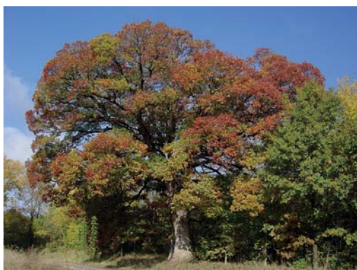
3 – Quercus alba, né en 1755 à Gudgel road, Athens, Illinois, USA

ce qui me concerne, le roi des chênes des USA. J'ai toujours aimé ses feuilles gigantesques prenant la couleur d'un grand vin de Bourgogne dans les meilleures années, et son tronc au rhytidome pâle (d'où le nom " alba "). Il atteint des tailles impressionnantes et une charpente régulière. En forêt, serré contre ses voisins, il présente un tronc droit et élevé; il s'étale avec grandeur quand il est isolé [Ill. 3]. Et je l'ai vu quasiment rampant sur les dunes de sable de l'île de Martha's Vineyard au Massachusetts. C'est aussi un des arbres de choix dans les cimetières américains de la côte ouest. Il est malheureusement difficile chez nous.