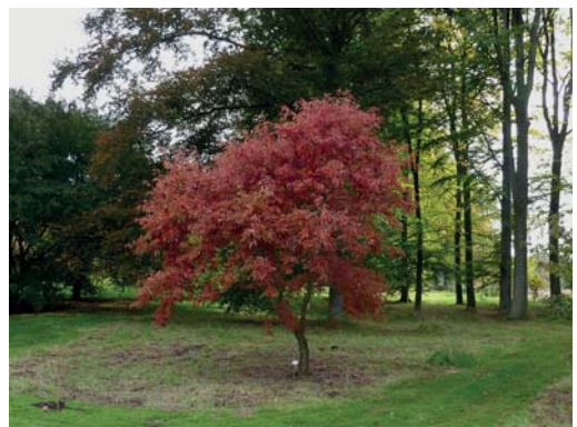
7 – Quercus serrata 'Herkenrode' (Tono Hetsuri, Honshu, Japon). Arb. Wespelaar